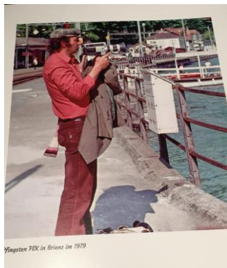
Fliegten FEX in Brissac im 1979

Der in Fachkreisen weltweit bekannte «Mister Pullman», Alby Glatt (1933-2014), war vor allem aufgrund seiner Leidenschaft für die alten, glorreichen europäischen Luxuszüge bekannt. Als Eisenbahnliebhaber ist er damit der Begründer der Renaissance der Luxuszüge in Europa. Er sammelte seit Anfang der 1970er Jahre Wagen der Compagnie Internationale des Wagons-Lits (CIWL) und Rheingold-Originalwagen der Deutschen Reichsbahn aus den 1920er und 1930er Jahren und liess sie mit Detailversessenheit in den Zustand ihrer Auslieferung restaurieren. Diesen Wagenpark setzte er unter dem Namen «Nostalgie Istanbul Orient-Express» für Fern- und Rundreisen international ein.